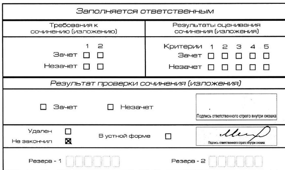
Рис. 12. Заполнение полей нижней части бланка регистрации (завершение написания сочинения (изложения) по уважительным причинам)

В случае если участник итогового сочинения (изложения) по состоянию здоровья или другим объективным причинам не может завершить написание итогового сочинения (изложения), он может покинуть место проведения итогового сочинения (изложения). Члены комиссии по проведению итогового сочинения (изложения) составляют «Акт о досрочном завершении написания итогового сочинения (изложения) по уважительным причинам» (форма ИС-08), вносят соответствующую отметку в форму ИС-05 «Ведомость проведения итогового сочинения (изложения) в учебном кабинете ОО (месте проведения)» (участник итогового сочинения (изложения) должен поставить свою подпись в указанной форме). В бланке регистрации указанного участника итогового сочинения (изложения) необходимо внести отметку «Х» в поле «Не закончил» для учета при организации проверки, а также для последующего допуска указанных участников к повторной сдаче итогового сочинения (изложения) в дополнительные сроки. Внесение отметки в поле «Не закончил» подтверждается подписью члена комиссии по проведению итогового сочинения (изложения).